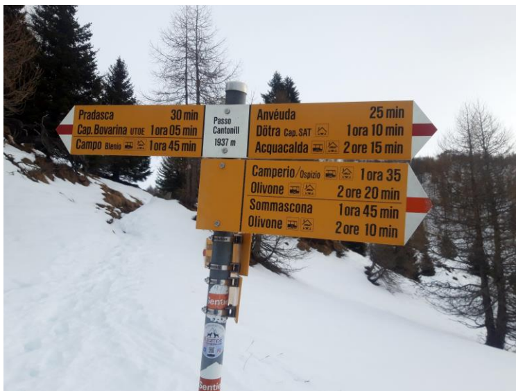
Il passo di Cantonil