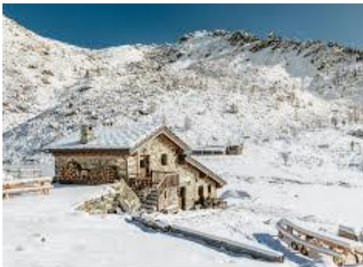
Il ristoro al Lago Muffé